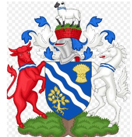
Flagge und Wappen von Oxfordshire